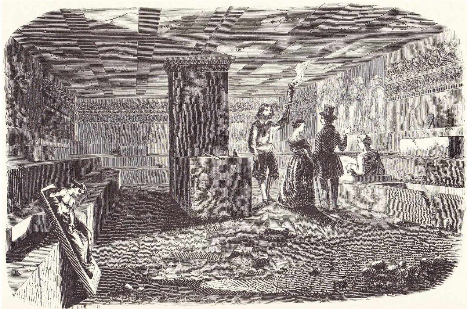
TOMBEAU ETRUSQUE, A CORNETO.